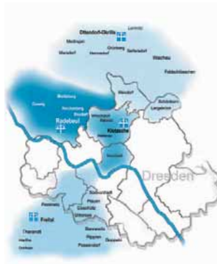
Die Sozialstationen Dresden, Freital, Ottendorf-Okrilla und Radebeul versorgen Patienten in der ganzen Region.

Das ist aber nicht alles: Privat können Sie selbstverständlich auch weitere Leistungen aus unserem Wahlleistungskatalog in Anspruch nehmen. Wir beraten Sie dazu gern.