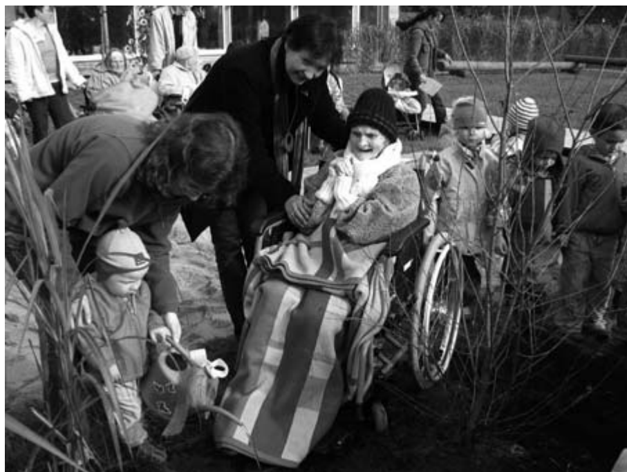
Fasching oder Kicker-WM – im Kindergarten Moritzburg ist immer etwas los